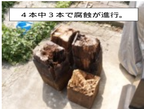
4本中3本で腐蝕が進行。

りも小なり腐蝕が進んでおりました。1箇所は隠れて、さまたけが原因で、銅板が剥がれ、錆がひどい状態です。お見舞い申し上げます。