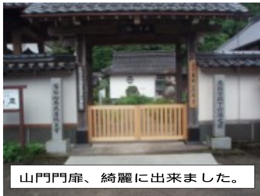
山門門扉、綺麗に出来ました。

ご協力をよろしく お願いいたします。 さて、お盆を前にして修繕工事は皆様の協力により、見事に完成致しました。 修繕の出来上がりについては、お寺にお越しの際に実際に確認願えればと思います。