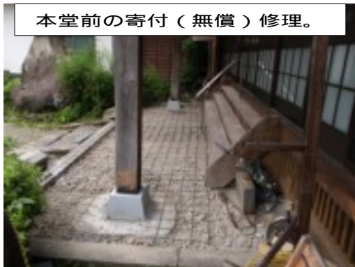
本堂前の寄付(無償)修理。

より本堂前の束石に替えても、明らなご提案を頂き、お見舞い申し上げます。無償で行って頂きました。