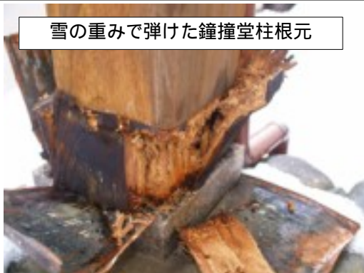
雪の重みで弾けた鐘撞堂柱根元

檀徒各位のご理解とご協力により、六月初旬から「雪害復旧工事」に掛かせて頂き、同月中に一応の完成の運びとなりました。