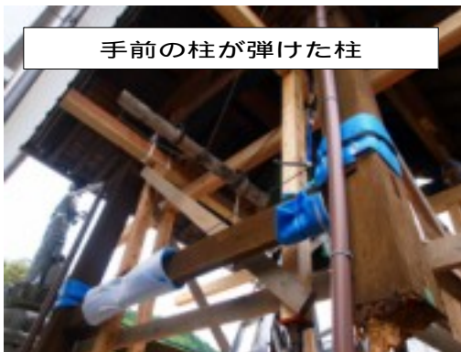
手前の柱が弾けた柱

腐蝕が進み潰れてしまった柱の根元を切断。切断して取り取った柱の寸法分の新しい束石を設置する。