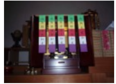
ご面倒掛けますが、工夫してお飾り下さい。