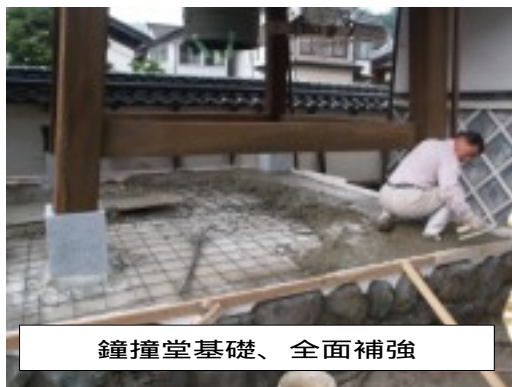
鐘撞堂基礎、全面補強

より本堂前の束石に替えても、明らなご提案を頂き、お見舞い申し上げます。無償で行って頂きました。