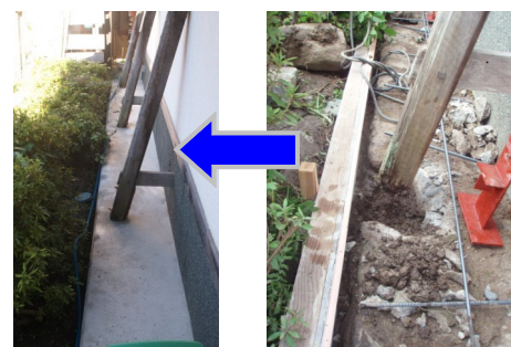
根元が腐って支柱の役目を果たさず。