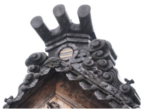
遠目には大丈夫そうに見えた旧鬼瓦（右）ですが、降ろしてみると可也亀裂（左）が入っていました。