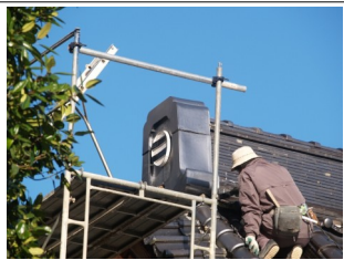
高い足場を組んでの作業となりました（右）。 取まった新鬼瓦（左）さっぱりとしていて、私は気に入っていますが、さて皆さんの評価は・・・

う訳では無いのですが、その対応は避けて通れず、先の11月下旬に交換工事の準備が整い徳山瓦店さんにて施工して頂きました。 今までの鬼瓦に比べてアツサリした印象の瓦ですが、接合箇所も少なく頑丈な印象です。 尚、旧来の鬼瓦は使える部品を組合せて、徳山瓦店様の協力のもと、モニユメントとして境内に据えよ