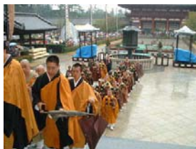
長い長い行列になりました。最後尾が入堂を終えるまで10分以上掛かったと思います。