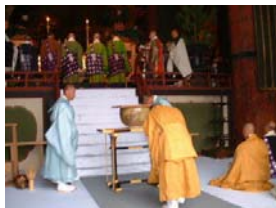
西大寺大茶盛による献茶。さすがに大きい