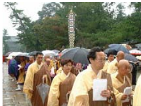
傘をさしての行列となりました。中には青年僧以外の方もチラホラ

企画した側とすれば、秋晴れの空の下、多くの参拝者の前で舞い散る色とりどりの散華と、朗々と轟く700名の出仕僧の声・・・と華やかな法要を思い描いていた訳ですが、雨で大仏殿内の法要では外からその様子は見ることは出来ません。残念なことです。しかし、出仕僧の大半の方は、東大寺の・・・しかも手を伸ばせば大仏様と言